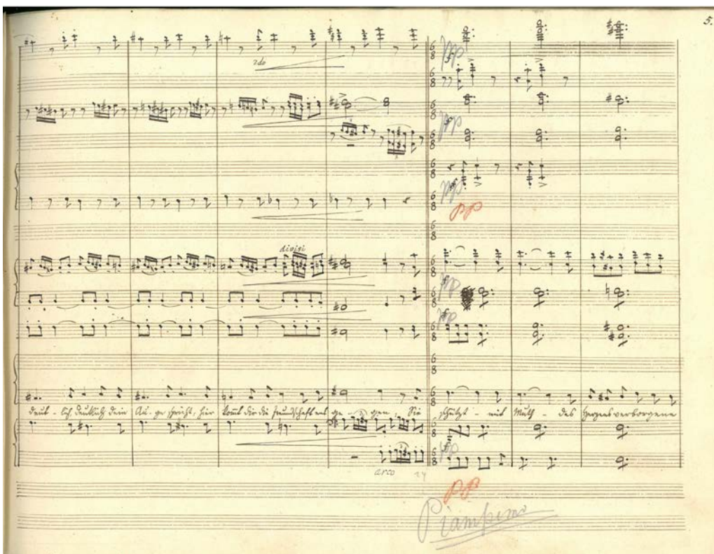
Operas Anglijas karogs partitūras lappuse. Edītes Plantagenetas ariozo skatā ar Berengāriju (3. cēliens). – Rokraksts LNB, NRt/36.