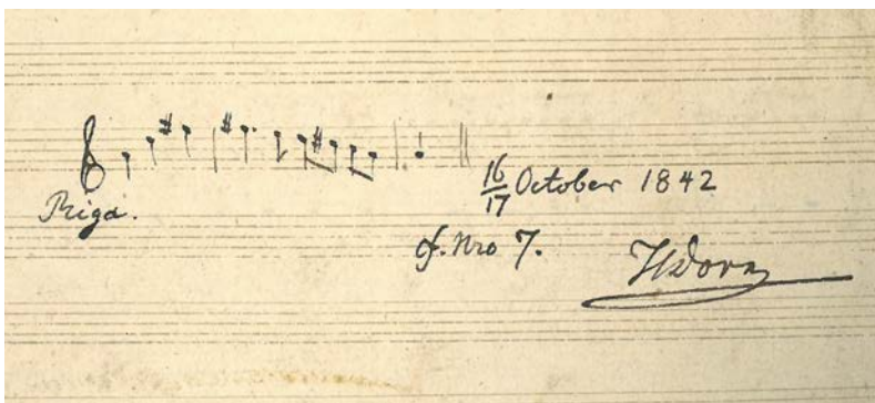
H. Dorna operas Anglijas karogs manskripts ar komponista autogrāfu. – LNB, NRt/36.